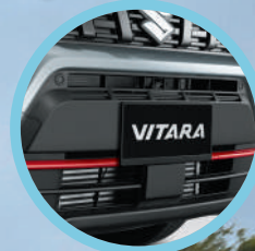
Skid plate negro frontal con línea intermedia color rojo.