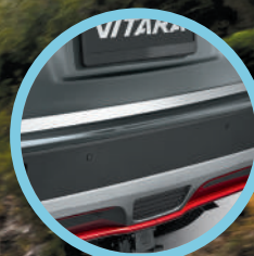
Moldura trasera cromada.