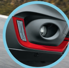
Moldura para faro.