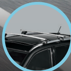
Barras de carga.