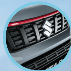
Parrilla delantera superior gruesa color rojo o negro mate.